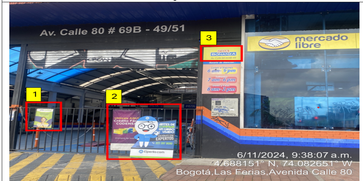
En la cual se evidencian tres (3) elementos PEV adicionales en fachada, identificados con los números 1, 2 y 3.