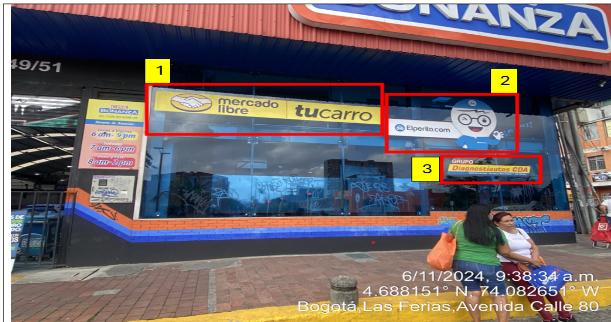
En la cual se evidencian tres (3) elementos PEV incorporados a las ventanas de la edificación, identificados con los números 1, 2 y 3.